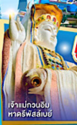
เจ้าแม่กวนอิม หาคิรีพัลลภย์