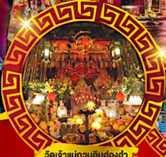
วัดเจ้าแม่กวนอิมซ่งฮ่า