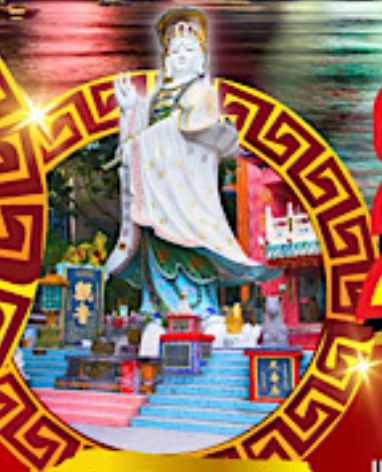
เจ้าแม่กวนอิม ทาดริฟส์ลีย์

ลดราคา 2,000 จาก 18,900 16,900 เหลือเพียง