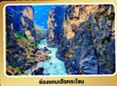
ช่องแคบเลียงกระโถน