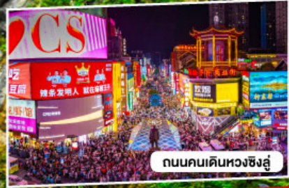
ถนนคนเดินหวงซิงอู่