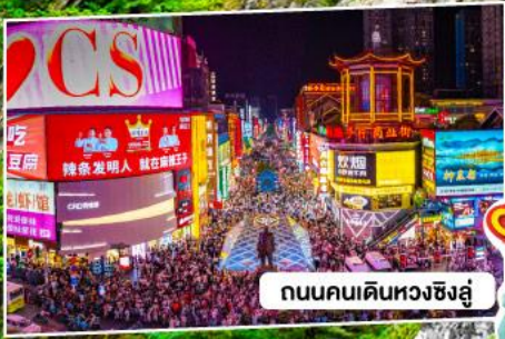
ถนนคนเดินหวงชิ่งลู่