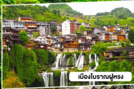
เมืองโบราณฝูหรง