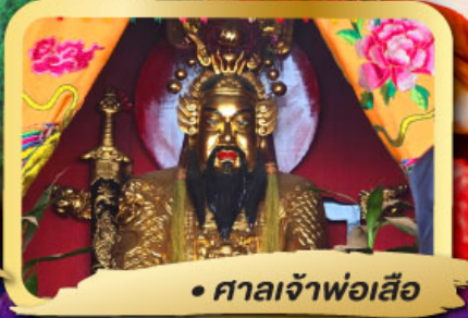
• ศาลเจ้าพ่อเสือ