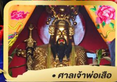
• ศาลเจ้าพ่อเสือ