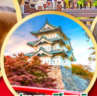
ปราสาทอิโรซากิ