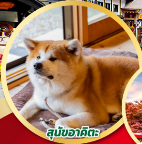
สุนัขอาคิตะ