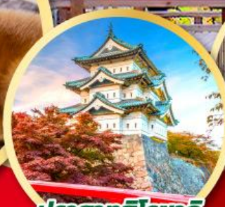
ปราสาทอิโรซากิ