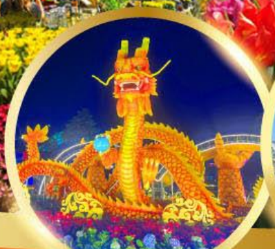
สะพานมังกรพันไฟ