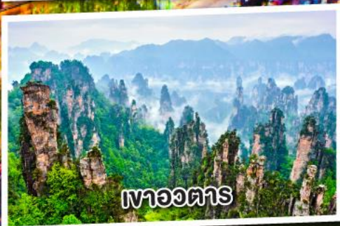
เขาอวดาร