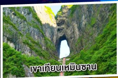
เขาเทียนเหมินซาน

เขาประตูล้ำเลิศ เมืองโบราณเฟิ่งหวง 5 วัน 4 คืน