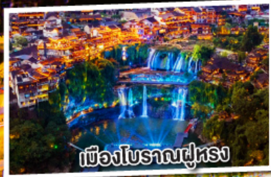
เมืองโบราณฝูหรง