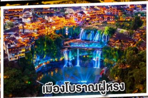
เมืองโบราณฝูหรง