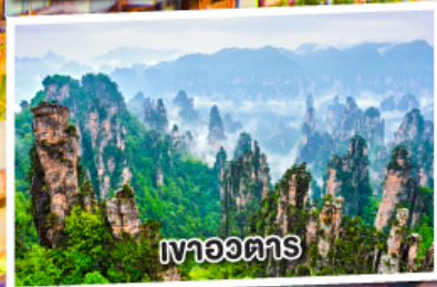
เขาอวดตาร