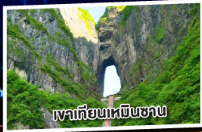
เขาเทียนเหมินซาน

เขาประตูสวรรค์ เมืองโบราณเฟิ่งหวง 5 วัน 4 คืน