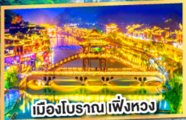
เมืองโบราณเพิ่งหวง