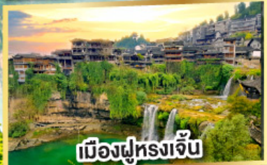
เมืองฝูหยงเจิน