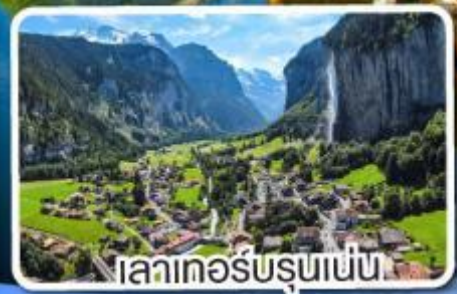
เลาเทอร์บรุนเนน

เดินทาง 20- 26 พ.ค. 67 29 พ.ค.- 04 มิ.ย. 67 05-11, 18-24 มิ.ย. 67 24-30 ก.ค. 67 16-22 ก.ย. 67 25 ก.ย.-01 ต.ค. 67