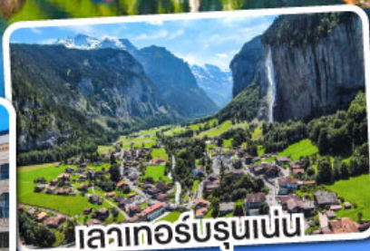
เลาเทอร์บรุนเนน