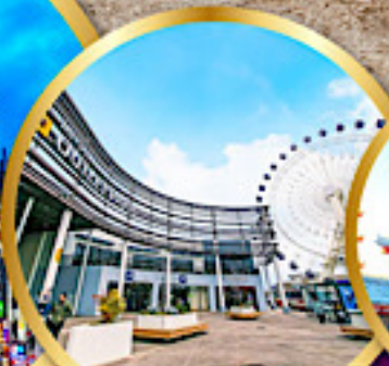
มิตซูบยาอากะไมล์พาร์ค เซนได