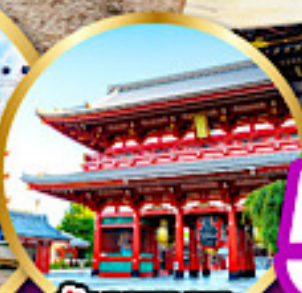
วัดไชยาคุงะ