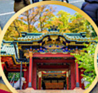
ศาลเจ้าโทโชคุ