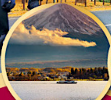
ทะเลสาบคาวากุจิโกะ