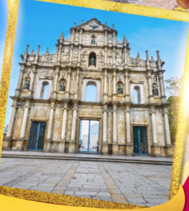
วิหารเซนต์ปอลเซนต์ปอล

เมนูพิเศษ! เป้าจ้อ, ซีฟู้ด และเปิดบิกกิ้ง+ไวน์แดง