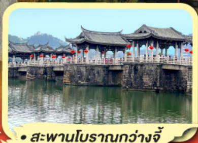
• สะพานโบราณกว่างจี้