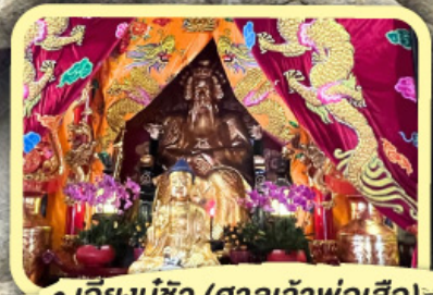
• เอียงบูชิว (ศาลเจ้าพ่อเสือ)