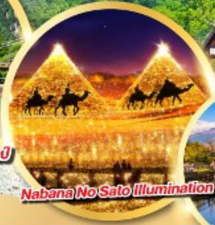
Nabana No Sato Illumination