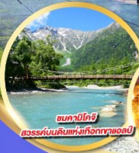
ชมคาบิโกจิ สวรรค์บนดินแห่งเทือกเขาแอลป์

นั่งกระเช้าลอยฟ้า 2 ชั้น ชินโฮทากะ หนึ่งเดียวในญี่ปุ่น แลนด์มาร์กยอดฮิตของโอคุซิดะ