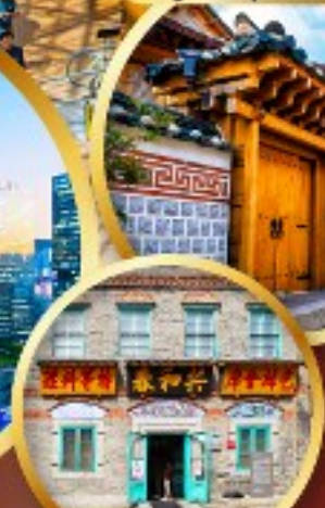
พิพิธภัณฑ์จางจิงมยอน