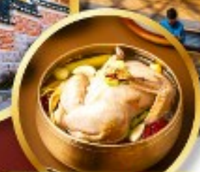
ไก่คุนโสม ระดับมิชลิน