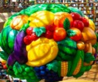
หมู่บ้านบุคchonอินอก