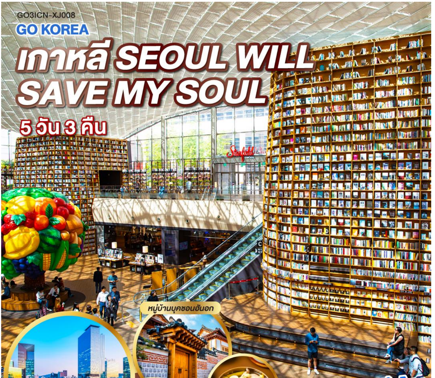
หมู่บ้านบุคซอนอันอก