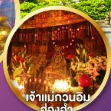
เจ้าแม่กวนอิม ฮ่องกง