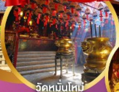
วัดหมื่นโหม่