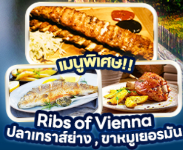
เมนูพิเศษ! Rib's of Vienna ปลาเทราสย่าง, บาหมูเยอรมัน