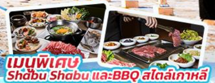
เมนูพิเศษ Shabu Shabu และ BBQ สไตล์เกาหลี