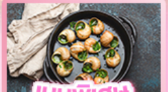
เมนูพิเศษ หอยเอสคาโท

เยอรมัน เนเธอร์แลนด์ เบลเยียม ฝรั่งเศส Keukenhof