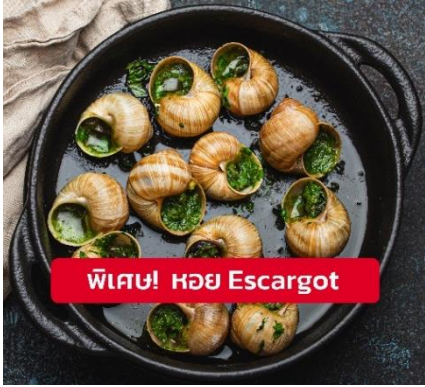
พิเศษ! หอย Escargot

📌 รับประทานอาหารเย็น (เมื่อที่12) เมนูพิเศษ!! หอย Escargot