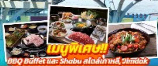
เมนูพิเศษ!! BBQ Buffet และ Shabu สดร้อนเกาหลี, Jjimdak

เดินทาง เมษายน - มิถุนายน สายการบิน Air Busan (BX) น้ำหนักกระเป๋า 20 KG