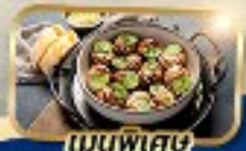
เมนูพิเศษ หอย Escargot