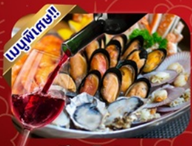
ซีฟู้ดไฮน์แดง