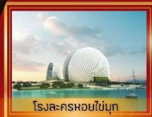
โรงละครหอยไข่มุก