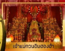
เจ้าแม่กวนอิมฮ่องกง