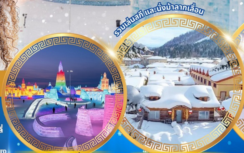
เทศกาลแกะสลักน้ำแข็ง

จตุรัสโบสถ์เซินโซเฟีย ถนนจงยง หมู่บ้านหิมะดินแดนมหัศจรรย์ อนุสาวรีย์ฝั่งหง สนุกสนานกับลานสกียาปูลี ถนนแฉ่ยูนเจีย เขาแกะหลัว เขาปังจย ภาพเขียน Ice and Snow แม่น้ำซงฮัวเจียง โซวี่ว้ายน้ำแข็ง เกาะพระอาทิตย์