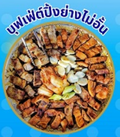
บุฟเฟ่ต์ปิ้งย่างไม่อื่น