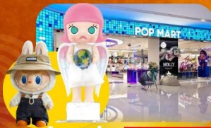
ช้อปจุ่ม POP MART