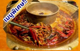
หม้อไฟเสฉวน