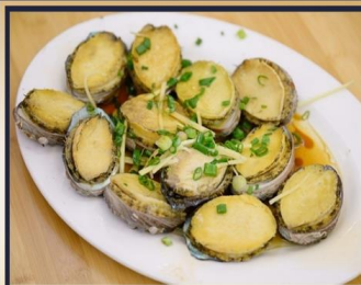
เป่าฮ้อสดนึ่ง