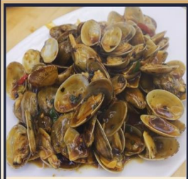
ผัดหอยลาย