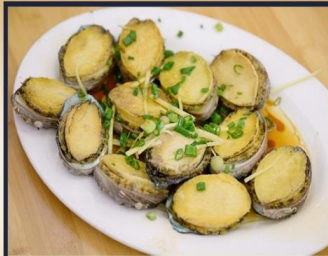
เป่าฮ้อสดหนึ่ง