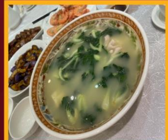
ซุปรังใส่หมู