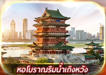
หอโบราณริมน้ำถึงหวง