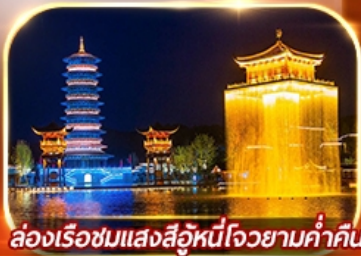
ล่องเรือชมแสงสีฉิวหนีโจวยามค่ำคืน