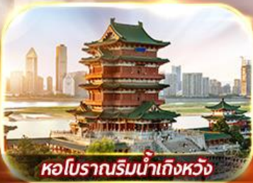
หอโบราณริมน้ำเกิ่งหวัง