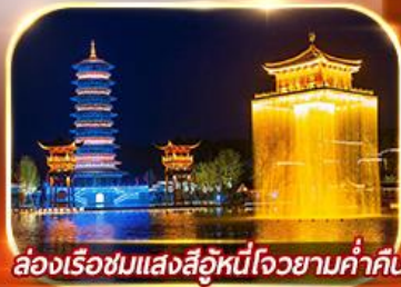
ล่องเรือชมแสงสีฉิวหนีโจวยามค่ำคืน