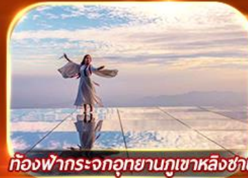
ท้องฟ้ากระจกอุทยานภูเขาหลิงซาน