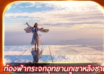
ท้องฟ้าระจกอุทยานภูเขาหลิงซาน