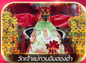
วัดเจ้าแม่กวนอิมฮองฮ่า