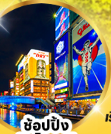
ช้อปปิ้ง ชินไซบาชิ