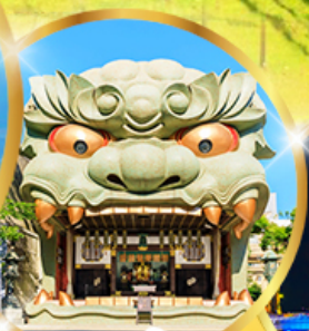
ศาลเจ้า ฟุชิมิ อินาริ