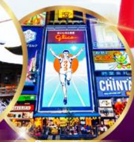
ช้อปปิ้ง ซินโซบาชิ

49,919 ราคา เดียว รวมภาษีมูลค่าเพิ่ม 7% บาท