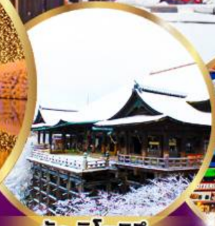
วัด คิโยมิสึ