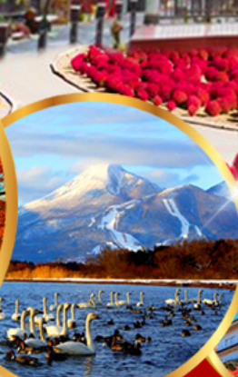
ทะเลสาบอินาวะชิโระ