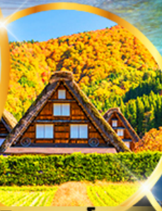
ชิราคาวาโกะ