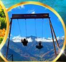
Yoo hoo! Swing