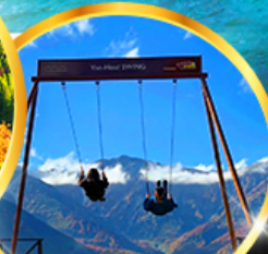
Yoo hoo! Swing