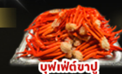
บุฟเฟ่ต์ขาปู

55,919 ราคาเริ่มต้น รวมภาษีมูลค่าเพิ่ม 7%