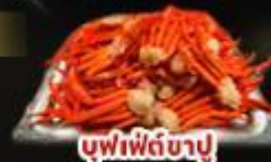
บุฟเฟ่ต์ซาซุ

พิททาคายาฆ่า 1 คิม | พิกนาคอซ่า 1 คิม พิทฟูจิ 1 คิม | ออนเซ็น 2 คิม