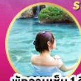
พักผ่อนแช่น้ำ 1 คืน