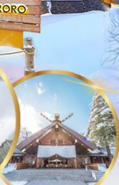
ศาลเจ้าฮอกไกโด