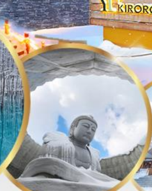
เป็นเขาแห่งพระพุทธเจ้า