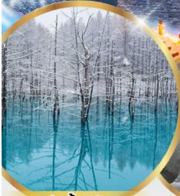
บ่อน้ำสีฟ้า