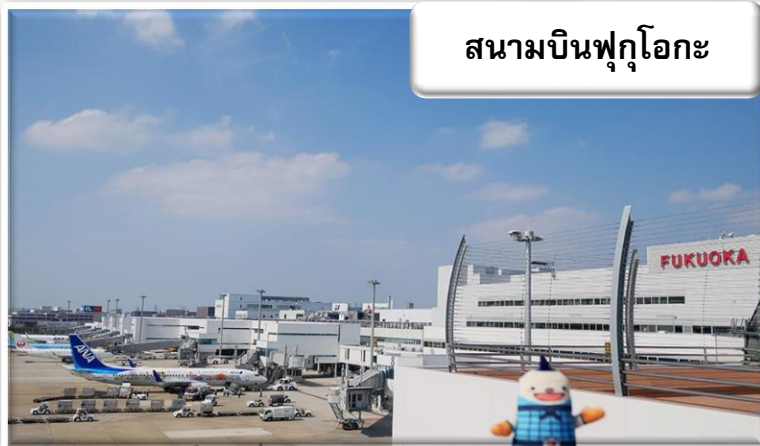
สนามบินฟุกุโอกะ

เวลา 07.05 น. เดินทางถึง สนามบินฟุกุโอกะ ประเทศญี่ปุ่น นำท่านผ่านขั้นตอนการตรวจคนเข้าเมืองและศุลกากร เวลาญี่ปุ่น เร็วกว่าประเทศไทย 2 ชั่วโมง