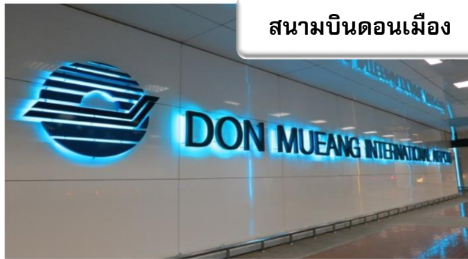
สนามบินดอนเมือง

เวลา 20.30 น. พร้อมกันที่ ท่าอากาศยานดอนเมือง อาคารผู้โดยสารขาออกระหว่างประเทศ เคาน์เตอร์สายการบินไทยแอร์เอเชีย เจ้าหน้าที่คอยให้การต้อนรับดูแลด้านเอกสาร เช็คอิน และสัมภาระในการเดินทาง เวลา 23.25 น. ออกเดินทางสู่ สนามบินฟุกุโอกะ ประเทศญี่ปุ่น โดยสายการบินไทยแอร์เอเชีย เที่ยวบินที่ FD 236