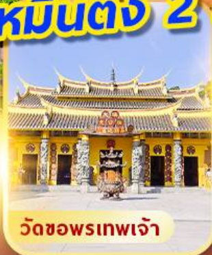
วัดซอพรเทพเจ้า