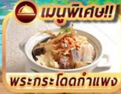
เมนูพิเศษ!! พระกระโดดกำแพง