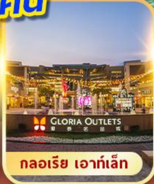
กลอเรีย เอาท์เล็ต