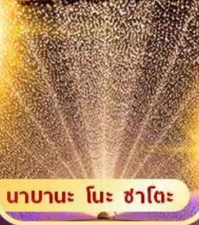
นาบานะ โนะ ซาโตะ