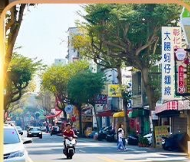
ถนนโบราณอันผิง