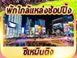
พิกโกลิแหล่งช้อปปิ้ง ซิเหมินตง