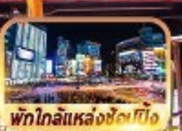
พิกโกลิแหล่งช้อปปิ้ง