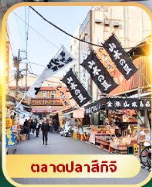
ตลาดปลาซึกี