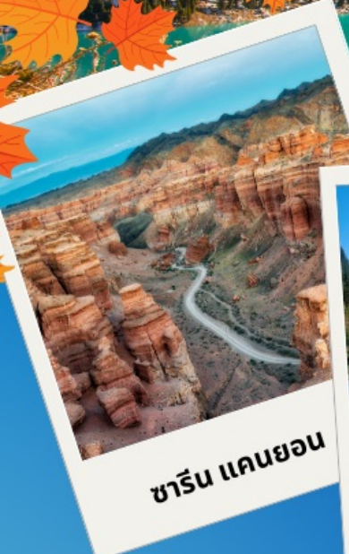
ชาริน แคนยอน