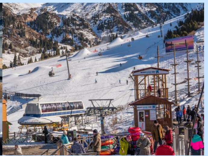
Shymbulak Ski Resort