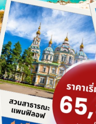
สวนสาธารณะแพนฟีลอฟ