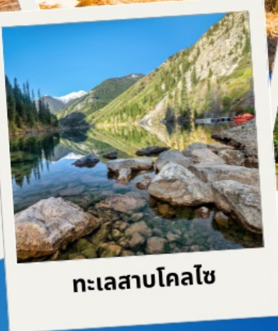
ทะเลสาบโคลไซ