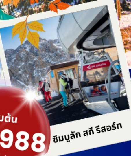
ซิมบูลัก สกี รีสอร์ท