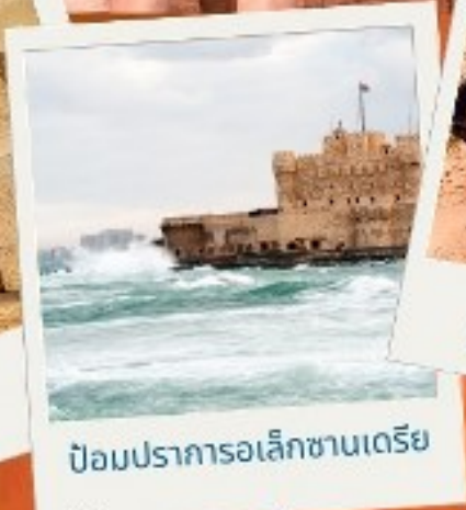
ป้อมปราการอเล็กซานเดรีย