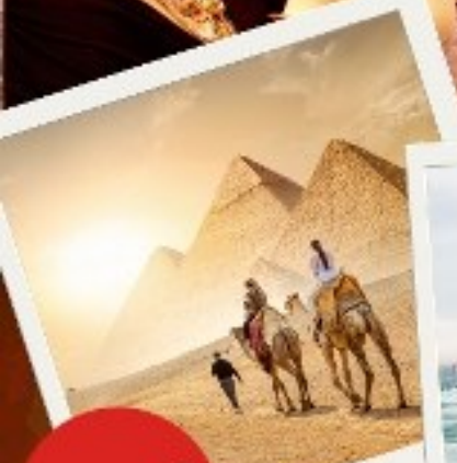
มหาปิรามิด