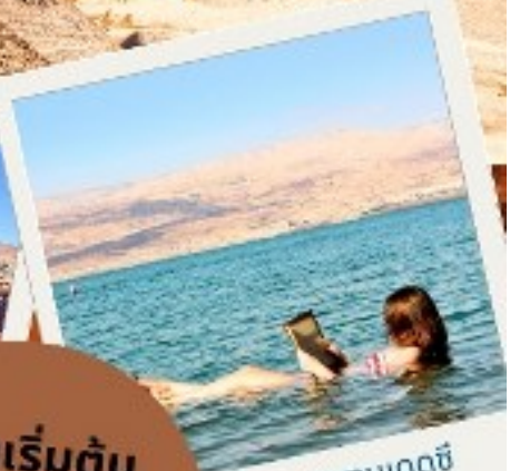
ทะเลสาบเดดซี