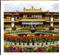
ตำหนักนอร์บูหลินมา

ชมวิวยอดเขานานเจียปาหว่า / จุดชมวิวกะเลปาหลูกลาง / อุทยานเขาเป็นยี่ / ระเบียบกระจก / วัดลามะ พระราชวังโปตาลา / วัดโจคัง / ถนนแปดเหลี่ยม / ทะเลสาบน้ำมูเซว / ตำหนักนอร์บูหลินมา / เมืองโบราณลั่วใต้