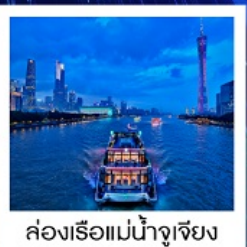
ล่องเรือแม่น้ำจูเจียง

ล่องเรือแม่น้ำจูเจียง / ช้อปปิ้งถนนปักกิ่ง / ช้อปปิ้งถนนซิงเซี่ยจิว / วัดโหลหนัน / ศาลเจ้าตระกูลเฉิน / ถนนคนเดินหย่งซิงฟาง