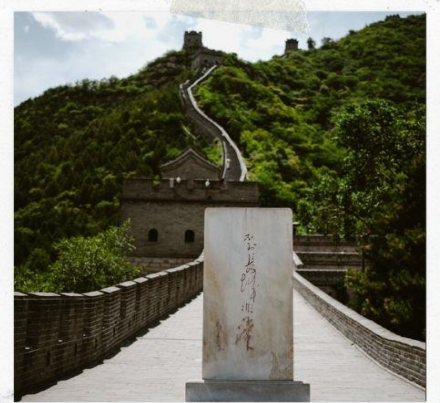
กำแพงเมืองจีน ด่านฉวิหยงกวน