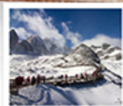
ไร่จรงเม่น้ำเยงอี

ลัดขีตมอว่ / ไร่จรงเม่น้ำเยงอี / เมืองโบรินชางกรี้ล่า / ไร่จรงชงจันหลิ่ง / เซ่งเกนเส็งกร้อด เมืองโบรินชางกรี้ล่า / ไร่จรงเม่น้ำเยงอี / ไร่จรงชงจันหลิ่ง / ไร่จรงชงจันหลิ่ง ไร่จรงชงจันหลิ่ง / ไร่จรงชงจันหลิ่ง / ไร่จรงชงจันหลิ่ง / ไร่จรงชงจันหลิ่ง