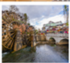
เมืองโบรินชางกรี้ล่า